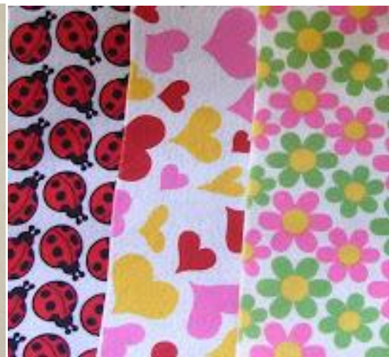
Kain Flanel Bermotif