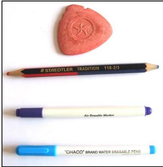
Contoh Beberapa Alat Tulis