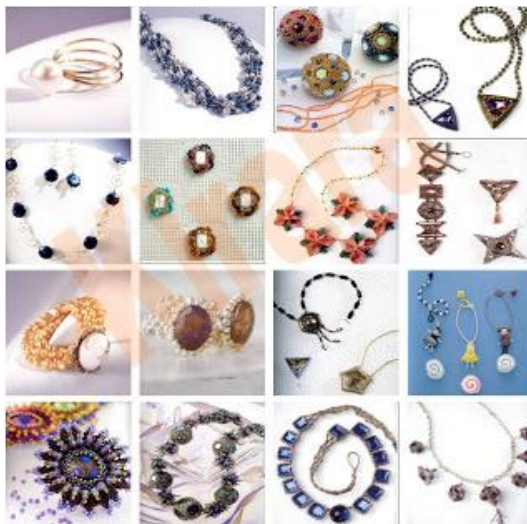
Contoh Aneka Bentuk Manik-Manik

Manik-manik berfungsi sebagai hiasan dekoratif pada kerajinan kain flanel. Bahan utama manik-manik adalah plastik dan gelas.