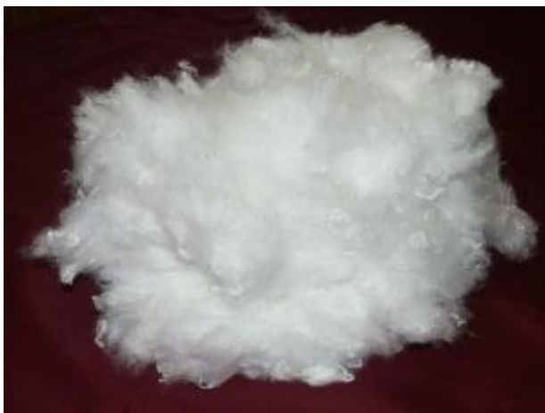
Dacron Bentuk Kapas

Dacron merupakan merek dagang untuk serat polyester sintetis yang memiliki sifat daya-kembang tinggi. Dacron ada yang berwujud seperti kapas alam, namun ada juga yang berupa lembaran.