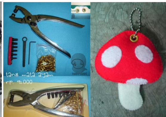
Warna Tang Mata Itik