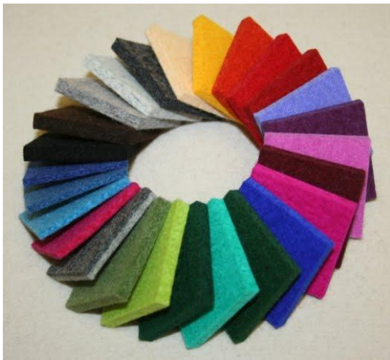
Kain Flanel Polos

Kain flanel terbuat dari serat wol tanpa ditenun. Tersedia aneka warna untuk memenuhi kebutuhan kerajinan tangan yang memakai kain ini sebagai bahan utama. Selain warn-warna polos, tersedia juga kain flanel bermotif.